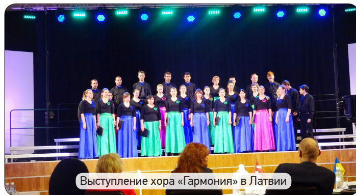
Выступление хора «Гармония» в Латвии