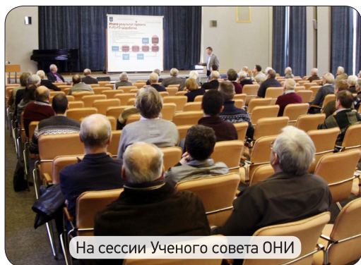
На сессии Ученого совета ОНИ

Следует отметить развитие важной деятельности отделения, направленной на создание (по инвестиционному проекту «Реконструкция» со сроком завершения в 2019 г.) инфраструктуры приборной базы строящегося реактора ПИК, энергетический пуск которого запланирован на 2018 г., а также создание источника холодных нейтронов на канале ГЭК-3 и части нейтронной системы, которая доставит нейтронные пучки от реактора в нейтронный зал.