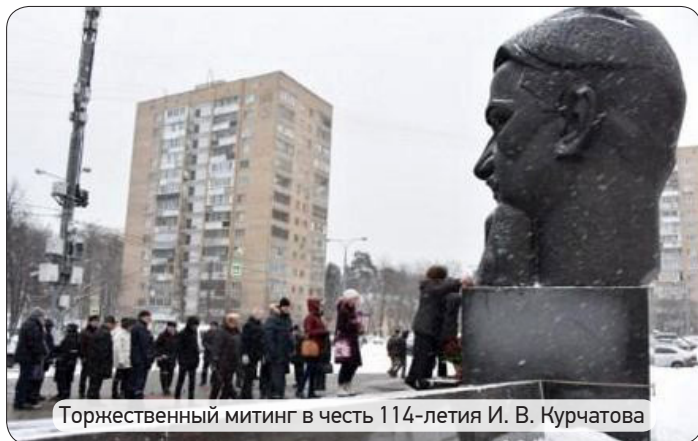
Торжественный митинг в честь 114-летия И. В. Курчатова

12 января в Курчатовском институте прошли торжественные мероприятия, посвященные 114-й годовщине со дня рождения основателя института, его первого директора – академика Игоря Васильевича Курчатова.