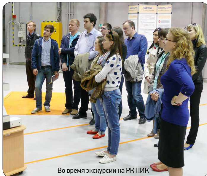
Во время экскурсии на РК ПИК

10 июня Институт посетили участники VI Научно-технической конференции молодых ученых и специалистов атомной отрасли «Команда-2015», собравшей более 270 представителей предприятий госкорпорации «Росатом» и компаний смежных отраслей. Главная цель конференции – предоставить молодым ученым и специалистам возможность обмена опытом, рассказать о своих профессиональных достижениях, научных разработках и открытиях. Основной темой конференции стало снижение стоимости и сроков реализации проектов для повышения конкурентных преимуществ на глобальном атомном рынке. В рамках технического тура в Институт участники конференции посетили РК ПИК, ускоритель Ц-80 и Отделение протонной терапии. По замыслу организаторов экскурсии опыт посещения уникальной своим сочетанием базовых установок площадки Института может стать для молодых специалистов сильнейшим мотивирующим фактором. Надо отметить, что надежды организаторов оправдались в полной мере: гости, каждый из которых уже состоялся как начинающий ученый или специалист своего дела, с неподдельным интересом осматривали установки, интересовались техническими подробностями их работы и задавали уточняющие вопросы сотрудникам Института.