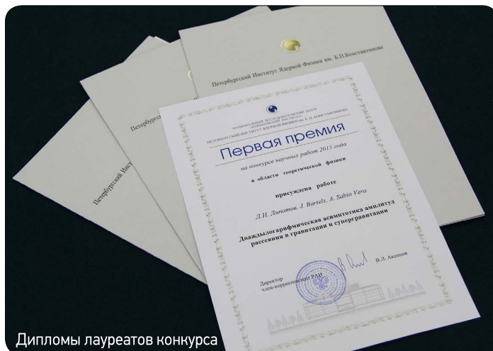
Дипломы лауреатов конкурса