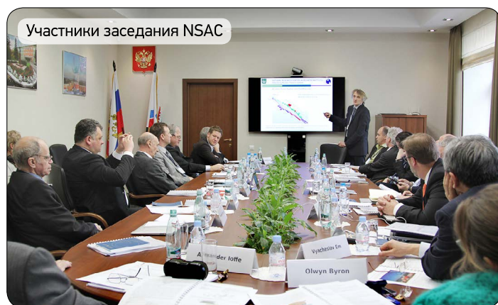
Участники заседания NSAC