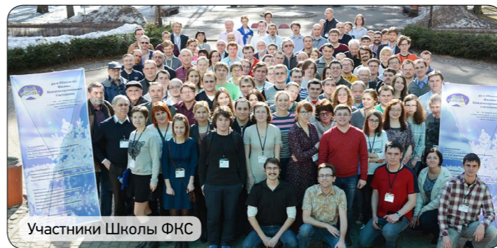
Участники Школы ФКС

В рамках пленарных лекций были прочитаны вводные и обзорные курсы лекций по различным направлениям современной фундаментальной и прикладной физики.