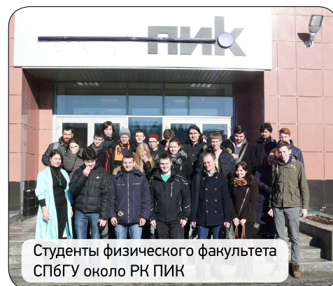
Студенты физического факультета СПбГУ около РК ПИК

12 марта с ознакомительной экскурсией Институт посетили студенты физического факультета Санкт-Петербургского государственного университета. Ребята побывали на РК ПИК, узнали об особенностях конструкции реактора и будущих нейтронных