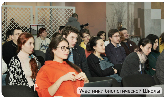
Участники биологической Школы