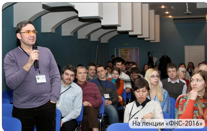
На лекции «ФКС-2016»

Переменная погода Северной столицы в этот период оказалась благосклонна к участникам Школы и позволила им не только